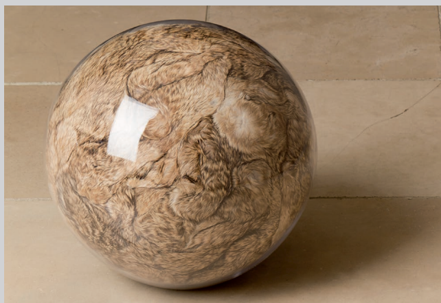
Hairy Eye Ball II, 2011, fourrure ancienne, polyester, verre, 35 x 35 x 33 cm