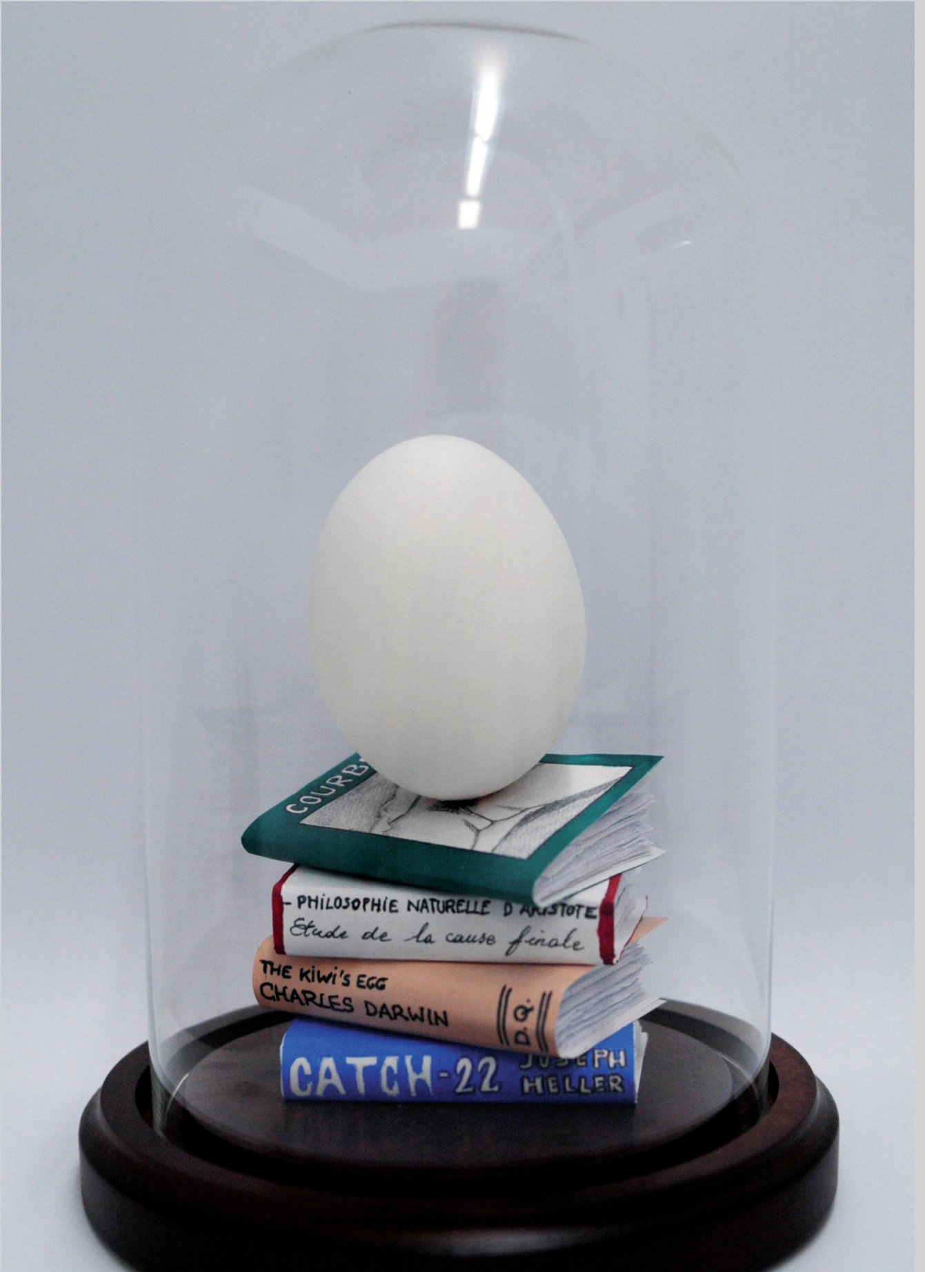
I came first, 2010, papier, acryliques, colle, coquille d'œuf, globe en verre sur support en bois, 13 x 13 x 19 cm