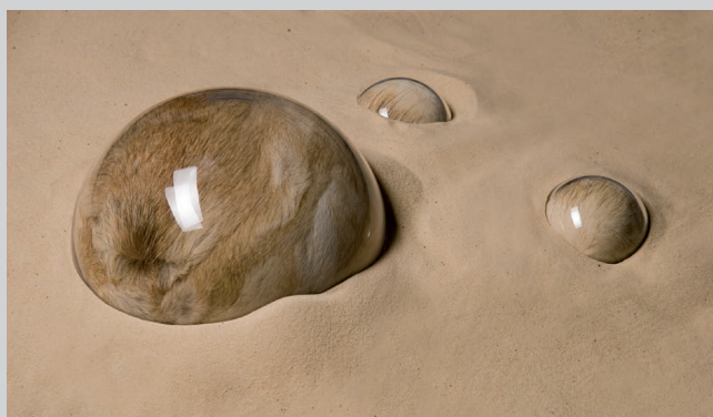
Emerging, 2011, fourrure ancienne, polyester, verre et sable, installation modulaire (comprenant 6 pièces en verre et 525 kg de sable)